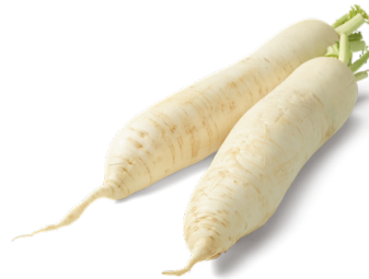
8. Radis long