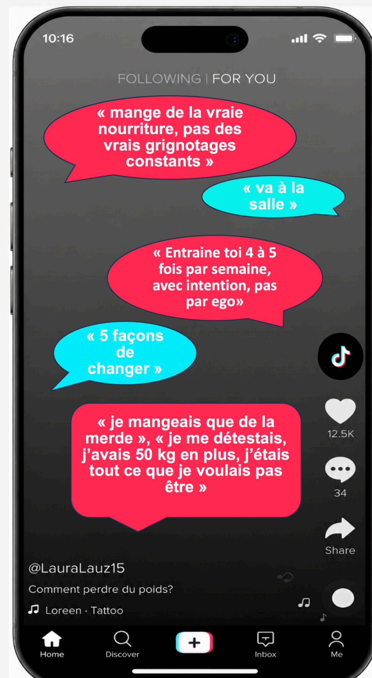
Figure 1 — Illustration des messages véhiculés pendant la première heure sur l'application

* Nous avons décidé d'étudier comment l'utilisation de TikTok chez les jeunes lausannois-es impacte les professionnel·les qui travaillent de près ou de loin autour de la question de l'obésité.